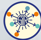
Comunicazioni condivise nelle agenzie