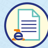
Documenti Catastali, Agenzia delle Entrate