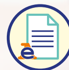
Documenti catastali, Agenzia delle Entrate

ma al contrario va interpretato come il miglior servizio disponibile in aiuto alla conclusione della vendita , per poter realizzare il massimo valore possibile in tempi brevissimi.